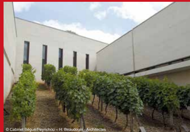
© Cabinet Bégue/Peyrichou - H. Beaudouin - Architectes

Mode d'emploi : Nombre de places limité, réservation obligatoire au 05 16 45 00 17. RDV place de la Salle Verte. Durée : 2h. Gratuit.