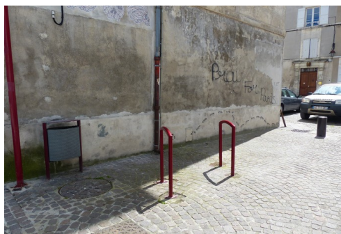
Emplacement n° 1