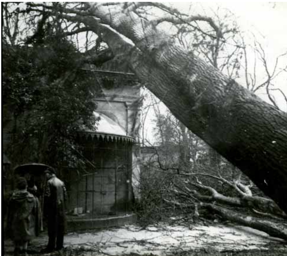
Jardin de l'Hôtel de Ville, tempête de 1935