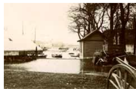
Inondations de 1904, Quais de la Salle Verte