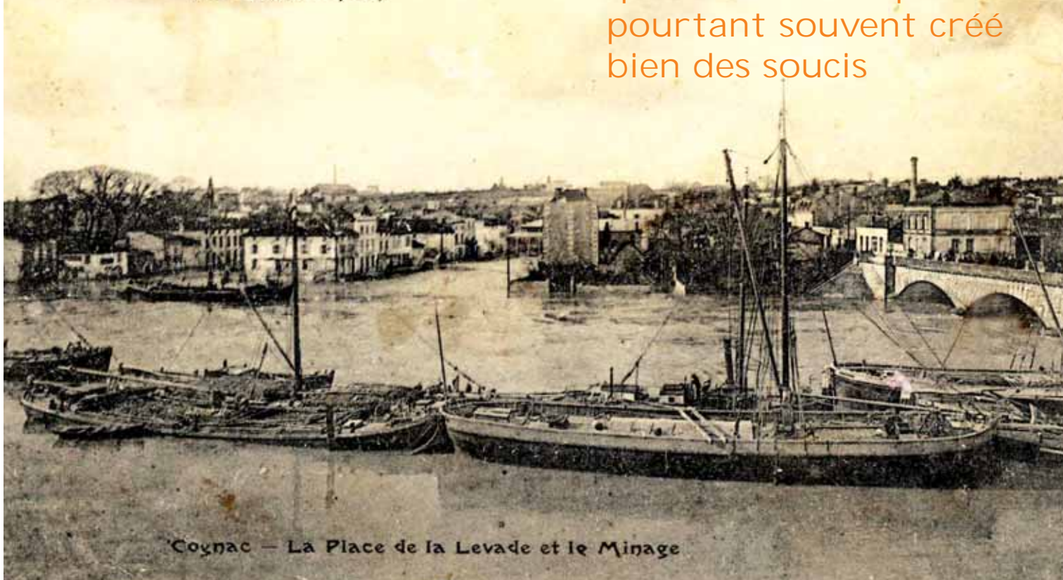
Cognac — La Place de la Levade et le Minage